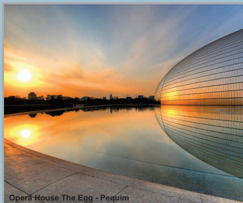
Opera House The Egg - Pequim