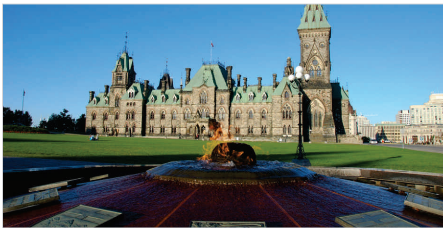
Parlamento - Ottawa